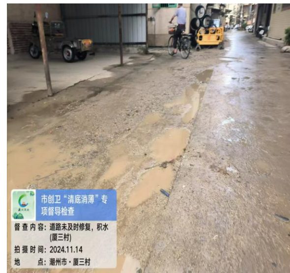
市创卫“清底消薄”专项督导检查 督查内容：道路未及时修复，积水（厦三村） 拍摄时间：2024.11.14 地点：潮州市·厦三村