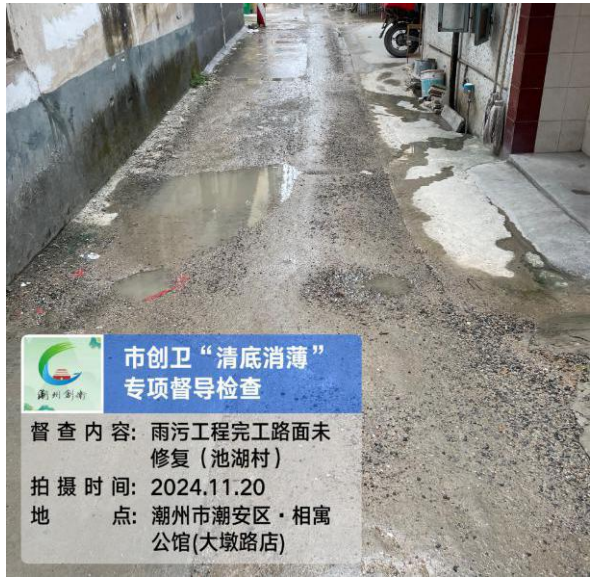
市创卫“清底消薄”专项督导检查 督查内容：雨污工程完工路面未修复（池湖村） 拍摄时间：2024.11.20 地点：潮州市潮安区·相寓公馆(大墩路店)