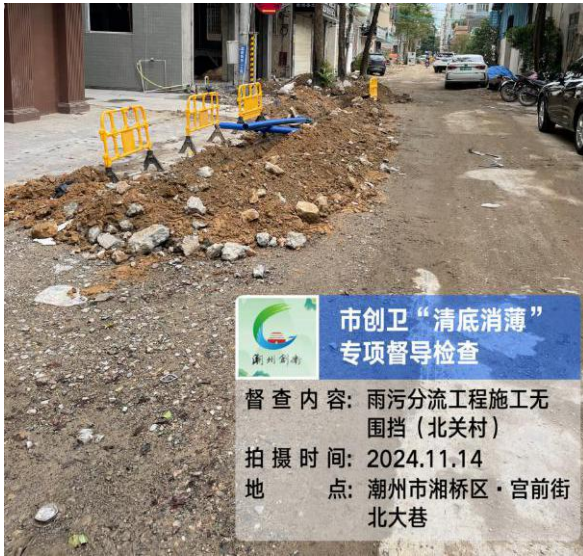
市创卫“清底消薄”专项督导检查 督查内容：雨污分流工程施工无围挡（北关村） 拍摄时间：2024.11.14 地点：潮州市湘桥区·宫前街北大巷