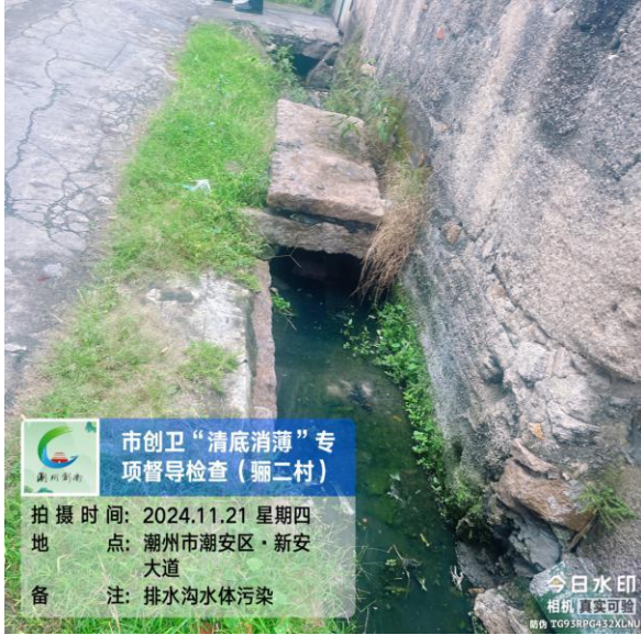
市创卫“清底消薄”专项督导检查（驷二村） 拍摄时间：2024.11.21 星期四 地点：潮州市潮安区·新安大道 备注：排水沟水体污染