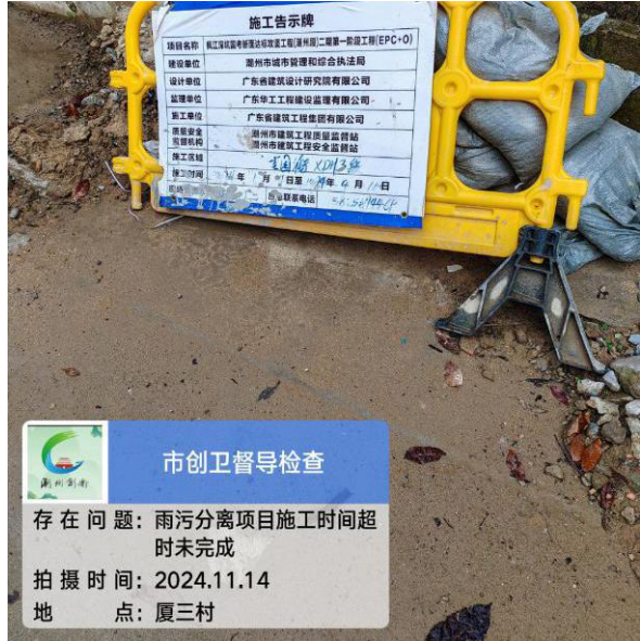
市创卫督导检查 存在问题：雨污分离项目施工时间超时未完成 拍摄时间：2024.11.14 地点：厦三村