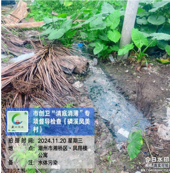
市创卫“清底消薄”专项督导检查（磷溪凤美村） 拍摄时间：2024.11.20 星期三 地点：潮州市湘桥区·凤翔楼公寓 备注：水体污染