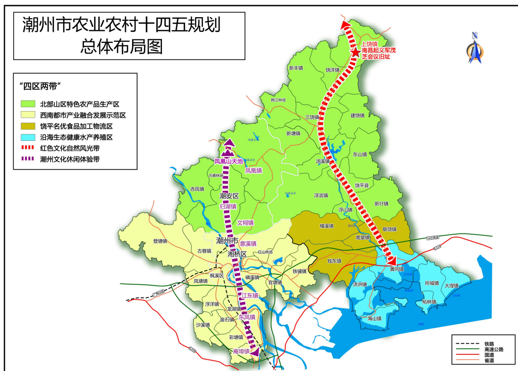
图 3-1 总体布局图