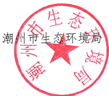
潮州市生态环境局