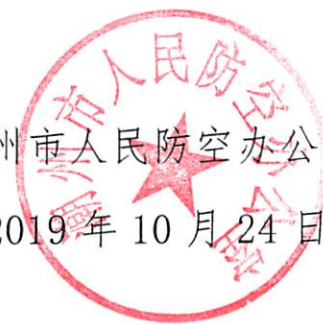
潮州市人民防空办公室