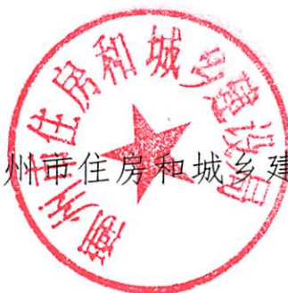
潮州市住房和城乡建设局